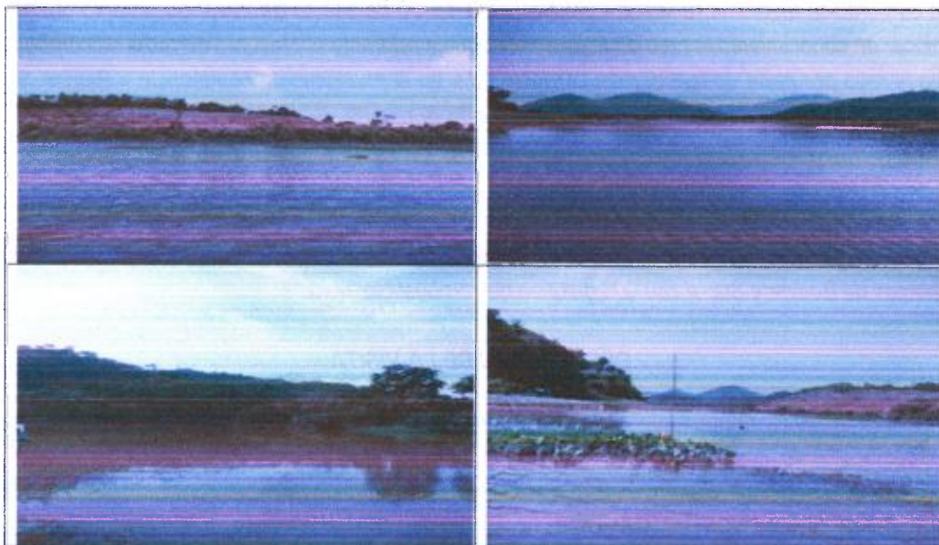
Tabla 1. Registro fotográfico de la visita.

Por lo anterior, se agrega el siguiente registro fotográfico de la visita realizada.